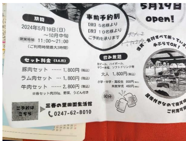
三春の里 田園生活館 https://miharu-mk.com/management/miharunosato